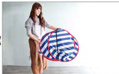
バランスを整えてゴムで留めます。