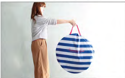
バッグに収納して完成です。