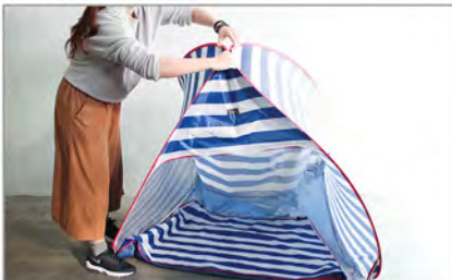
頂部をつかみ二つ折りにします。