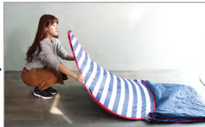
頂部から下に向けて畳みます。