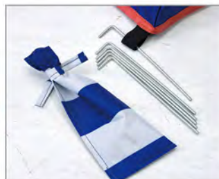
風があっても安心なベグ付き。