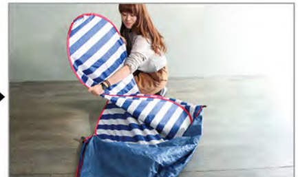
片側を少し内側に丸めこみます。