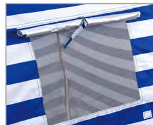
裏側の窓で通気性抜群。