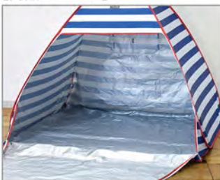
シルバーコーティングで UVカット。